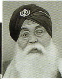
Kahan Singh Nabha, 1861–1938