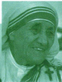
Madre Teresa di Calcutta